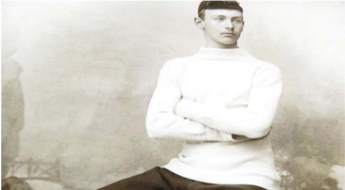
Hans „Joan“ Gamper im Jahre 1899 in Barcelona.

Der FC Barcelona sorgt weltweit für Begeisterung bei Fussballfans. Das Team von Trainer Pep Guardiola spielte in den letzten Jahren nicht nur den erfolgreichsten Fussball, es kommt mit seinem Spiel auch dem „perfekten Fussball“ am nächsten. Die Wurzeln des Phänomens liegen in der Schweiz.