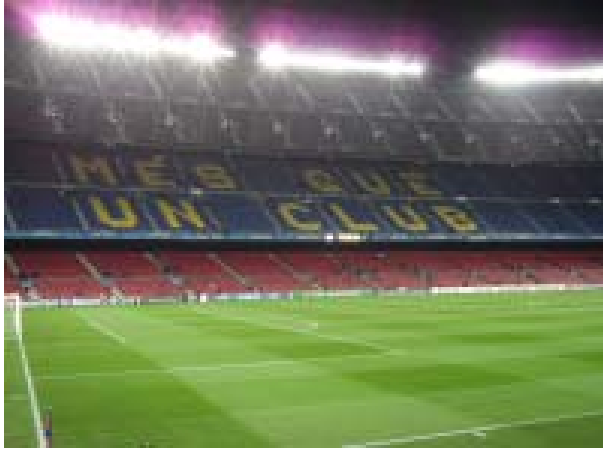
Der FC Barcelona: Mehr als ein Klub.

Der FC Barcelona reiht aber auch sonst Superlative an Superlative: Mit einem Fassungsvermögen von fast 100'000 Zuschauern ist das Stadion Camp Nou das grösste Fussballstadion Europas und mit mehr als 162'000 Mitgliedern ist der FCB der zweitgrösste Sportverein weltweit. Zu diesem gehören auch andere Sport-Sektionen wie Handball, Basketball, Futsal, Rollhockey, Baseball oder Eishockey. Und wenn man beim FC Barcelona etwas in Angriff nimmt, dann richtig: Die Handballabteilung ist mit sieben Titeln in der EHF Champions League die erfolgreichste Mannschaft auf europäischer Klubebene. Die Basketballer feierten im Jahr 2003 ihren grössten Erfolg und gewannen erstmals die ULEB Euroleague, die wichtigste Trophäe im europäischen Basketball. Der Jugendarbeit des Vereins entstammt auch NBA-Star Pau Gasol von den Los Angeles Lakers.