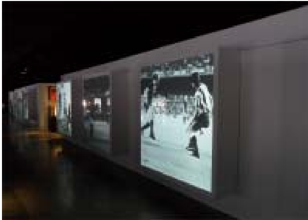
Das Museum des FC Barcelona legt Zeugnis der Geschichte des Vereins ab.

Landes verweisen, untersagte ihm jeglichen Kontakt zum FC Barcelona und liess das Stadion für ein halbes Jahr sperren.