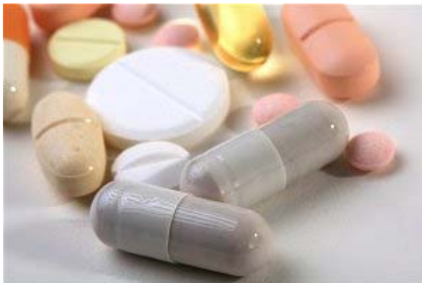
Unzählige Anti-Depressiva brachten kaum Besserung