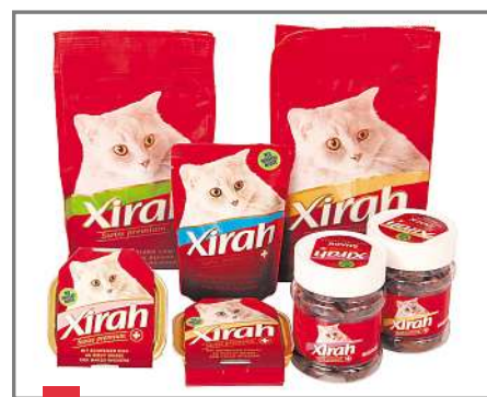
Premium-Linie fürs Büsi.