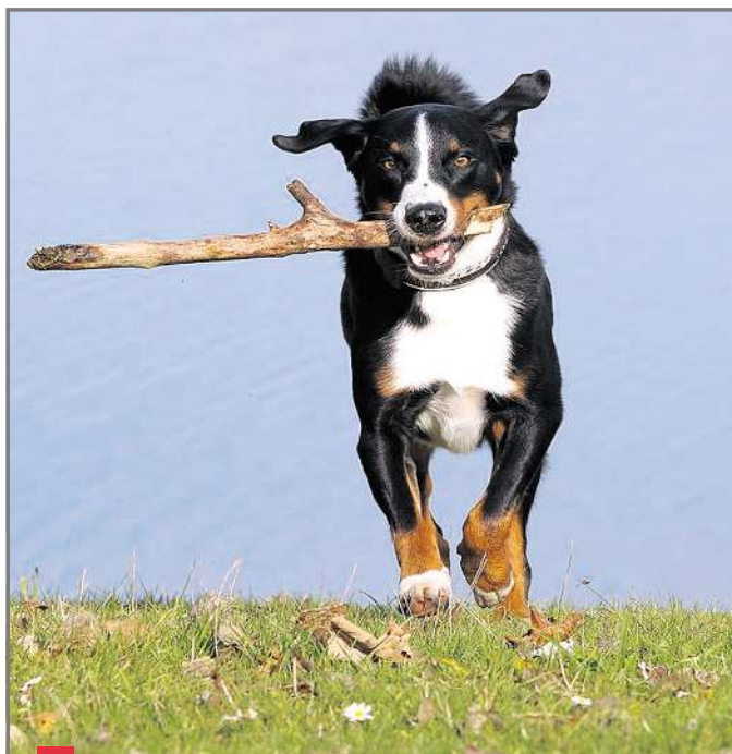
Der beste Freund des Menschen verursacht nicht zu unterschätzende Kosten.

Gemäss der Haushaltsbudgeterhebung 2007 des Bundesamts für Statistik wendete die Schweizer Bevölkerung 0,3 Prozent des monatlichen Haushaltsbudgets für