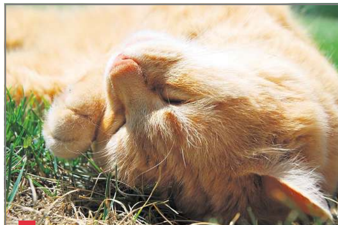
Katzen als Gourmets und Geniesser.